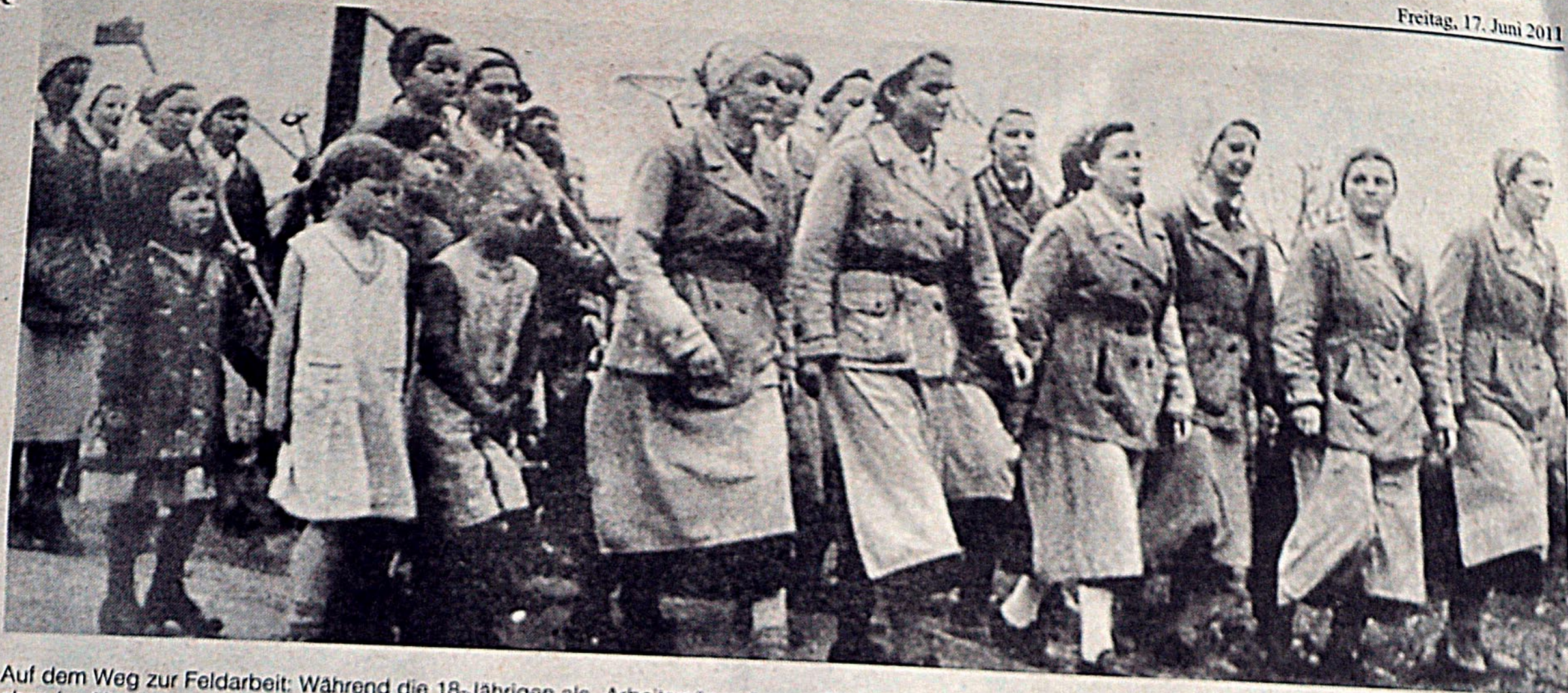
Auf dem Weg zur Feldarbeit: Während die 18-Jährigen als „Arbeitsmänner“ zum „Ehrendienst am deutsche Volke“ zwangsrekrutiert wurden, leisten ab 1938 Mädchen im Alter bis zu 25 Jahren – die Maiden – ihr „Pflichtjahr“ in der Landwirtschaft ab. Sie zogen in Lebus 1937 in das Lager ein, das vorher vom Reichsarbeitsdienst genutzt wurde.